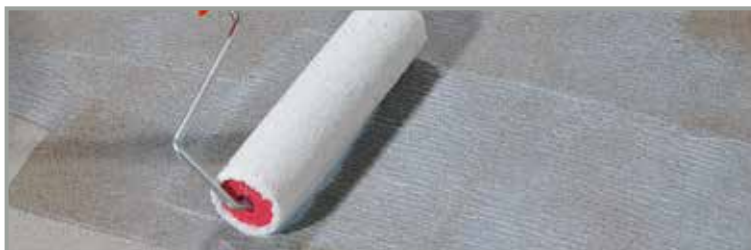
Innan plattsättning är ARDEX P 51 idealisk som vattenavvisande grundning på gipsunderlag

Med valet av storformatplattor följer som regel önskemål om smalast möjliga fogar. Fogbredden kan inte endast väljas utifrån estetiska aspekter utan måste även ta hänsyn till byggtkniska krav. Utöver det estetiska så är fogens utformning viktig för att säkerställa en lång hållbarhet på den keramiska beläggningen. ARDEX fogar håller den kvalitet som behövs och ger den färdiga ytan ett elegant utseende.