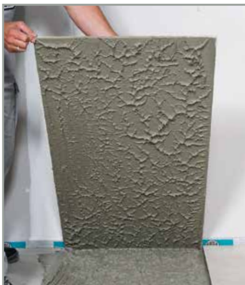
Med ARDEX X 78 MICROTEC får man en hålrumsfri och fullständig täckning

Till detta är MICROTEC-fästmassan ARDEX X 78 idealisk. Den är speciellt utvecklad för plattsättning på golv och förenar fördelarna från ett flytfix med egenskaperna från ett flexfix. Därmed uppnår man nästan en fullständig täckning under plattorna. ARDEX X 78 ger också en högre stabilitet och viskositet i fixet och undgår svagheterna i flytfixet, nämligen att plattorna sjunker och pressar upp fästmassa i fogarna.