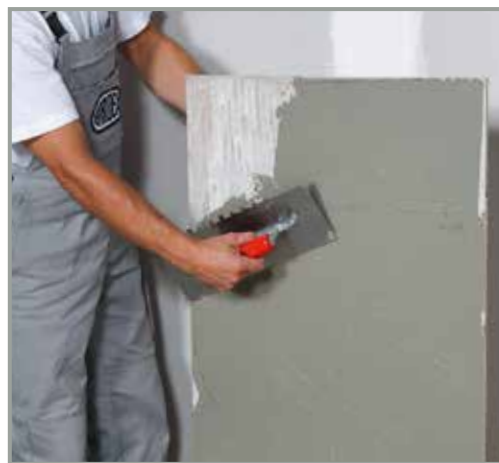
ARDEX X 78 MICROTEC och buttering-floating metoden ger en förbättrad täckning

Tack vare de goda självnivellerande egenskaperna hos ARDEX K 14 (tunt skikt) och ARDEX K 70 (tjockt skikt) ger de ett optimalt plant underlag för läggning av storformatsplattor och natursten. Innan avjämning påbörjas ska underlaget alltid primas. Prima med ARDEX P 51 enligt anvisningar i datablad.